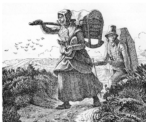
Natmandsfolk på vandring Tegning af Chr. Dalsgaard 1856

Ud fra disse oplysninger er der jo meget stor sandsynlighed for at "Fandens Slot" er opkaldt efter den "Gule Rakker".