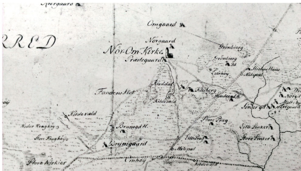
Kort fra 1797