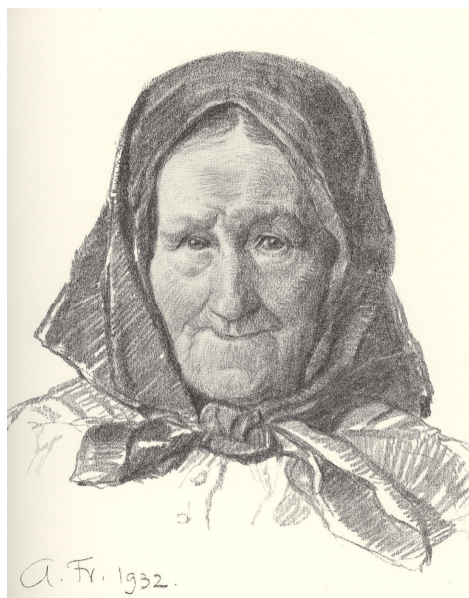
Mæt Mari Mus af Kjæltringslægt fra Dejbjerg Tegnet i 1932 af Achton Friis